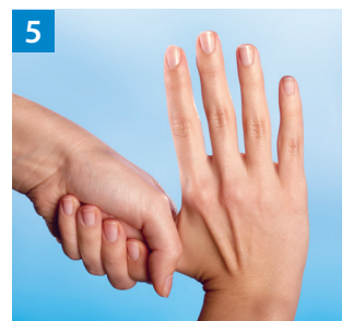
Schritt 5 Kreisendes Reiben des rechten Daumens in der geschlossenen linken Handfläche und umgekehrt.