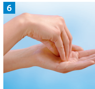
Schritt 6 Kreisendes Reiben hin und her mit geschlossenen Fingern der rechten Hand in der linken Handfläche und umgekehrt.