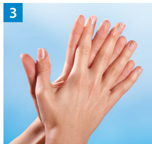
Schritt 3 Handfläche auf Handfläche mit verschränkten, gespreizten Fingern.