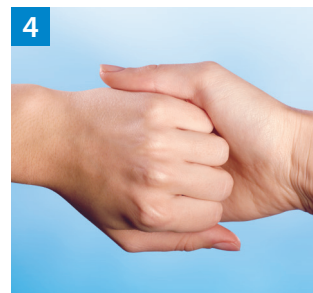
Schritt 4 Außenseite der Finger auf gegenüberliegende Handflächen mit verschränkten Fingern.