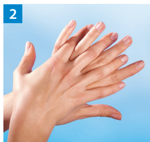
Schritt 2 Rechte Handfläche über linkem Handrücken und linke Handfläche über rechtem Handrücken.