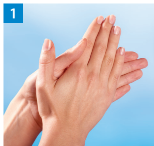
Schritt 1 Handfläche auf Handfläche.